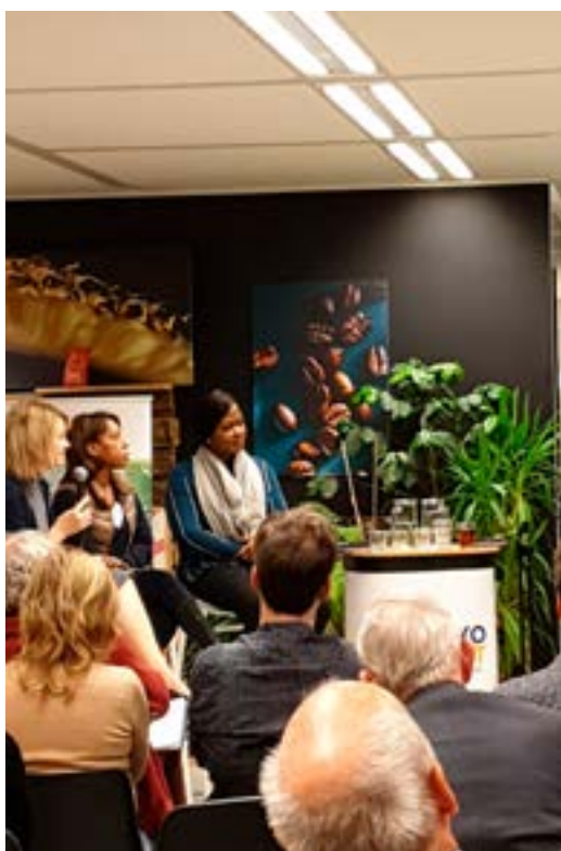
Een OikoTalk met twee cacao'oerinnen uit Ivoorkust en Tony's Chocolonely.