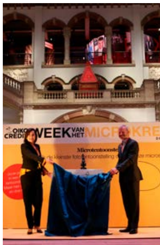
De speciale leden-only-opening van de microtentoonstelling in het Tropenmuseum, als start van de allereerste Week van het Microkrediet.