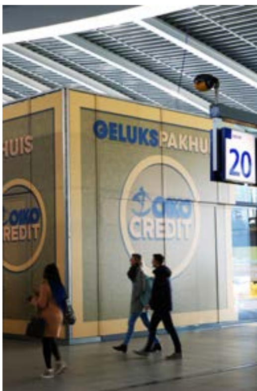
Bewustwordingscampagne 'Het GeluksPakhuis' op Utrecht Centraal Station.