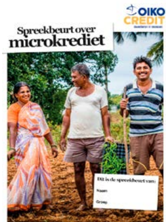
Spreekbeurtpakket over microkrediet, speciaal ontwikkeld voor basisschoolleerlingen.